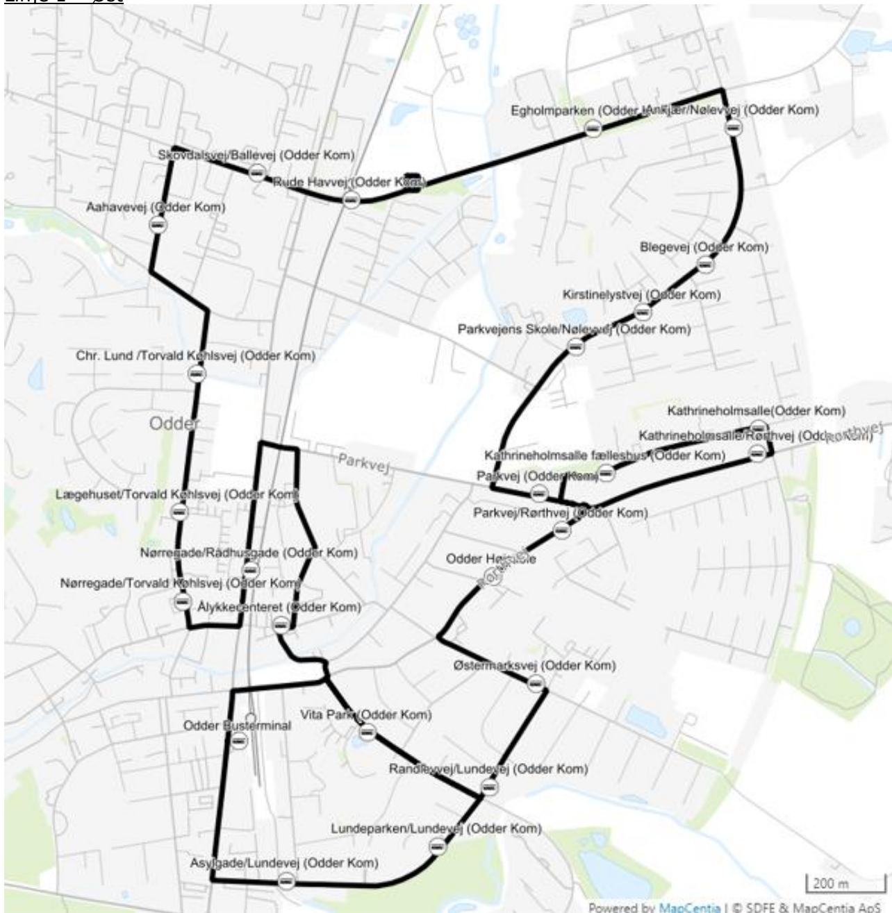
Figur 1 Ruteforløb for den østlige bybuslinje i Odder